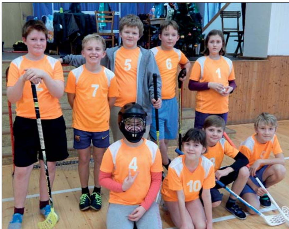
Účastníci florbalového turnaje